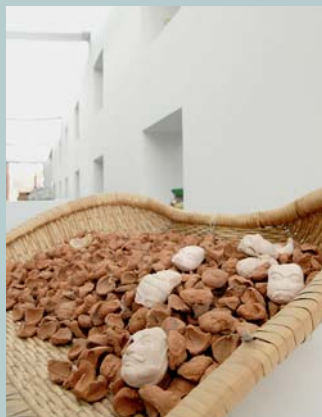
Jacques Kaufmann Entre rien et quelque chose. Musée de céramique française à FLICAM, Fuping, Chine.

La Revue de la céramique et du verre Publication bimestrielle 61, rue Marconi, BP 3 62880 Vendin-le-Vieil Téléphone 03 21 79 44 44 Télécopie 03 21 79 44 45 www.revue-ceramique-verre.com