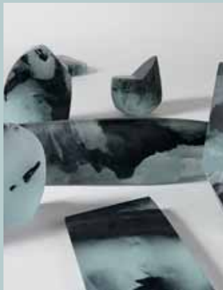
Perrin & Perrin Œuvres, 2008. Technique build-in-glass.

La Revue de la céramique et du verre Publication bimestrielle 61, rue Marconi, BP 3 62880 Vendin-le-Vieil Téléphone 03 21 79 44 44 Télécopie 03 21 79 44 45 www.revue-ceramique-verre.com