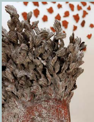
Agnès His Buisson Grand Vent , 2009. H. 60 cm. au mur Expire , 60 éléments. Grès, lavis d'engobes, 1165°C.

La Revue de la céramique et du verre Publication bimestrielle 61, rue Marconi, BP 3 62880 Vendin-le-Vieil Téléphone 03 21 79 44 44 Télécopie 03 21 79 44 45 www.revue-ceramique-verre.com