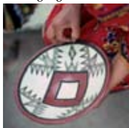
Sœur Madeleine Allain