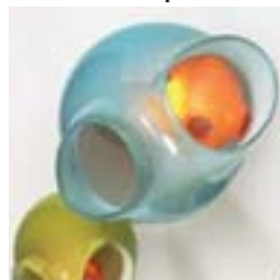
Thierry de Beaumont