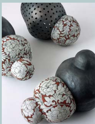
Daphne Corregan Tête à tête , 2009. Trois pièces. H. 21 à 26 cm. Grès et terre enfumée.

La Revue de la céramique et du verre Publication bimestrielle 61, rue Marconi, BP 3 62880 Vendin-le-Vieil Téléphone 03 21 79 44 44 Télécopie 03 21 79 44 45 www.revue-ceramique-verre.com